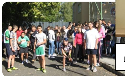
Európai Diáksport Napja